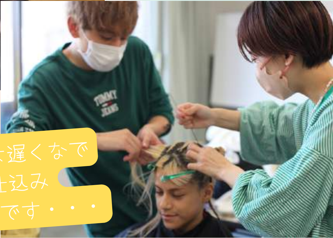
昨日は遅くまで 仕込み 寝不足です・・・