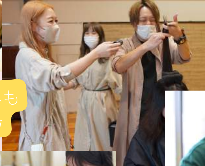
遊びも仕事も 一生懸命