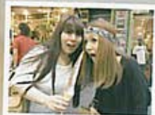
旅行が大好き。写真は韓国へ行った時のもの。