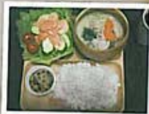
時間がとれる休日は、自分で料理もつくります。